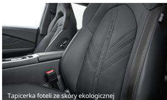
Tapicerka foteli ze skóry ekologicznej