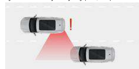
Ostrzeżenie o ruchu poprzecznym z tyłu (RCTA)