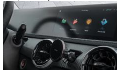
Android Auto i Apple CarPlay