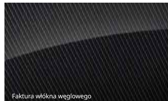
Faktura włókna węglowego