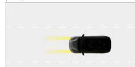
Automatyczne włączanie i wyłączenie świateł drogowych (HBA)