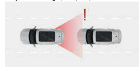
System ostrzegający przed kolizją czołową (FCW)