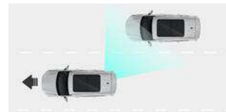
Czujniki martwego pola (BSD)