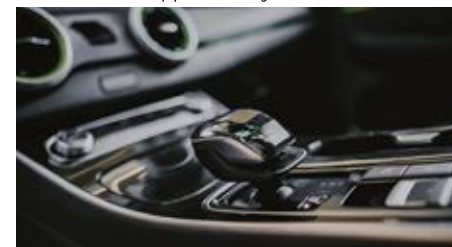
Kryształowa gałka zmiany biegów