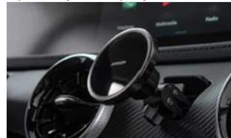
Centralny port pod uchwyt na telefon