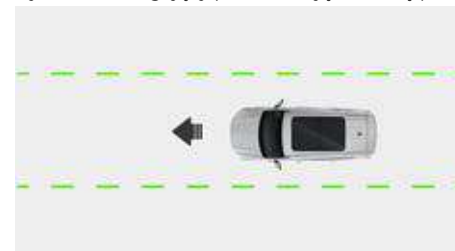
System stabilizacji toru jazdy (ESP/ESC)